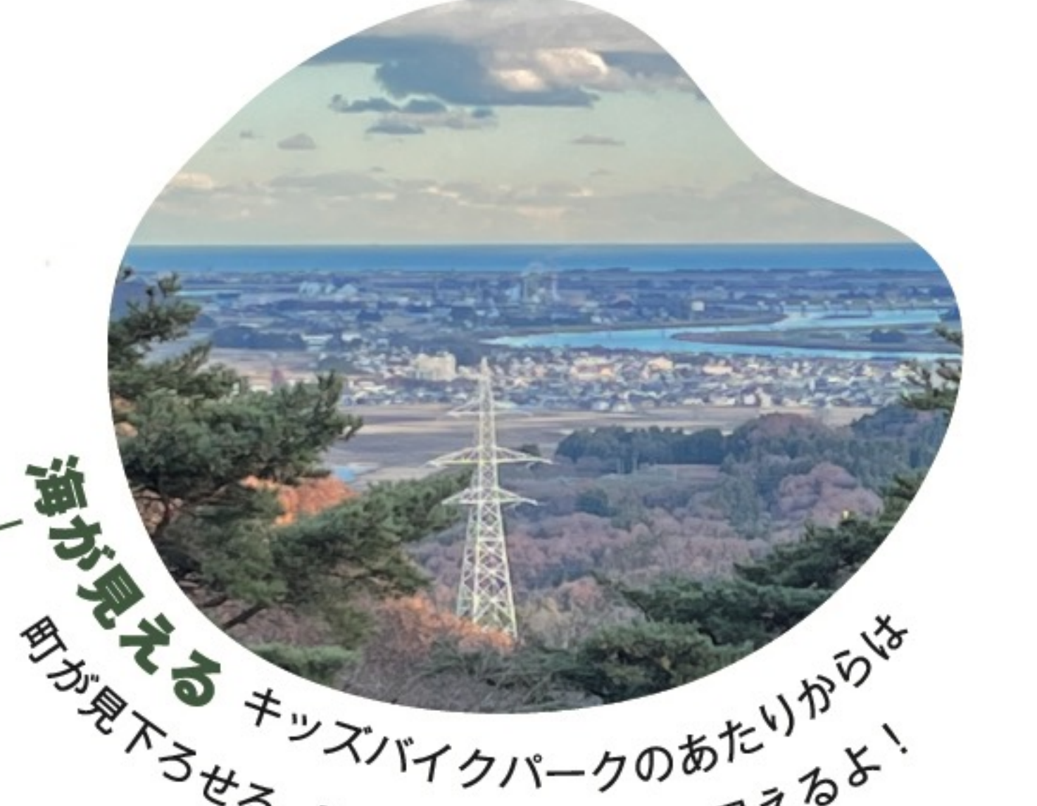
海が見える キッズバイクパークのあたりからは海が見えるよ。天気がいいと海まで見えるよ!