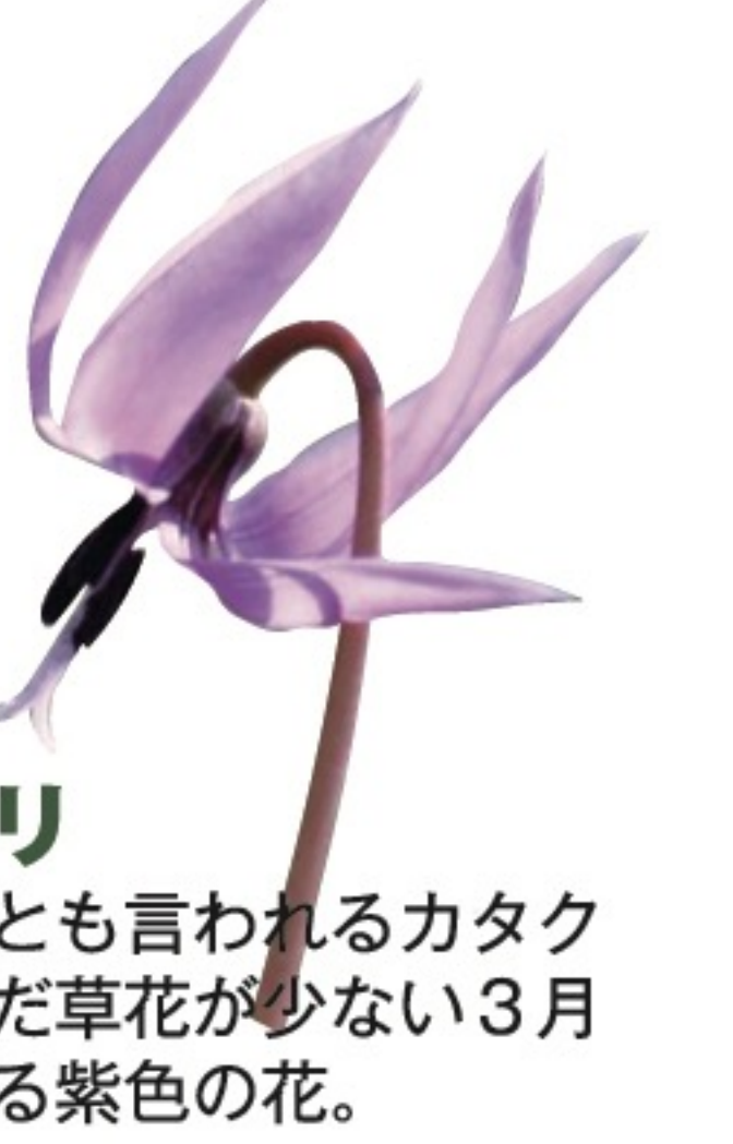
カタクリ 春の妖精とも言われるカタクリは、まだ草花が少ない3月頃見つける紫色の花。