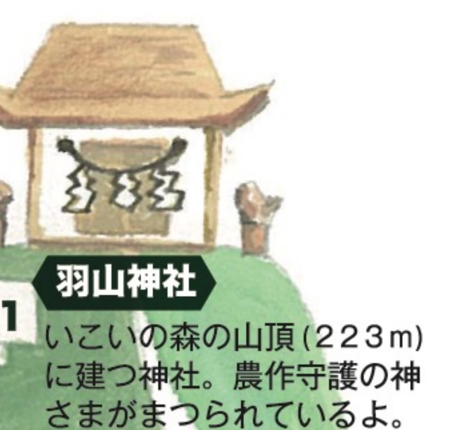
羽山神社 いこいの森の山頂(223m)に建つ神社。農作守護の神さまがまつられているよ。