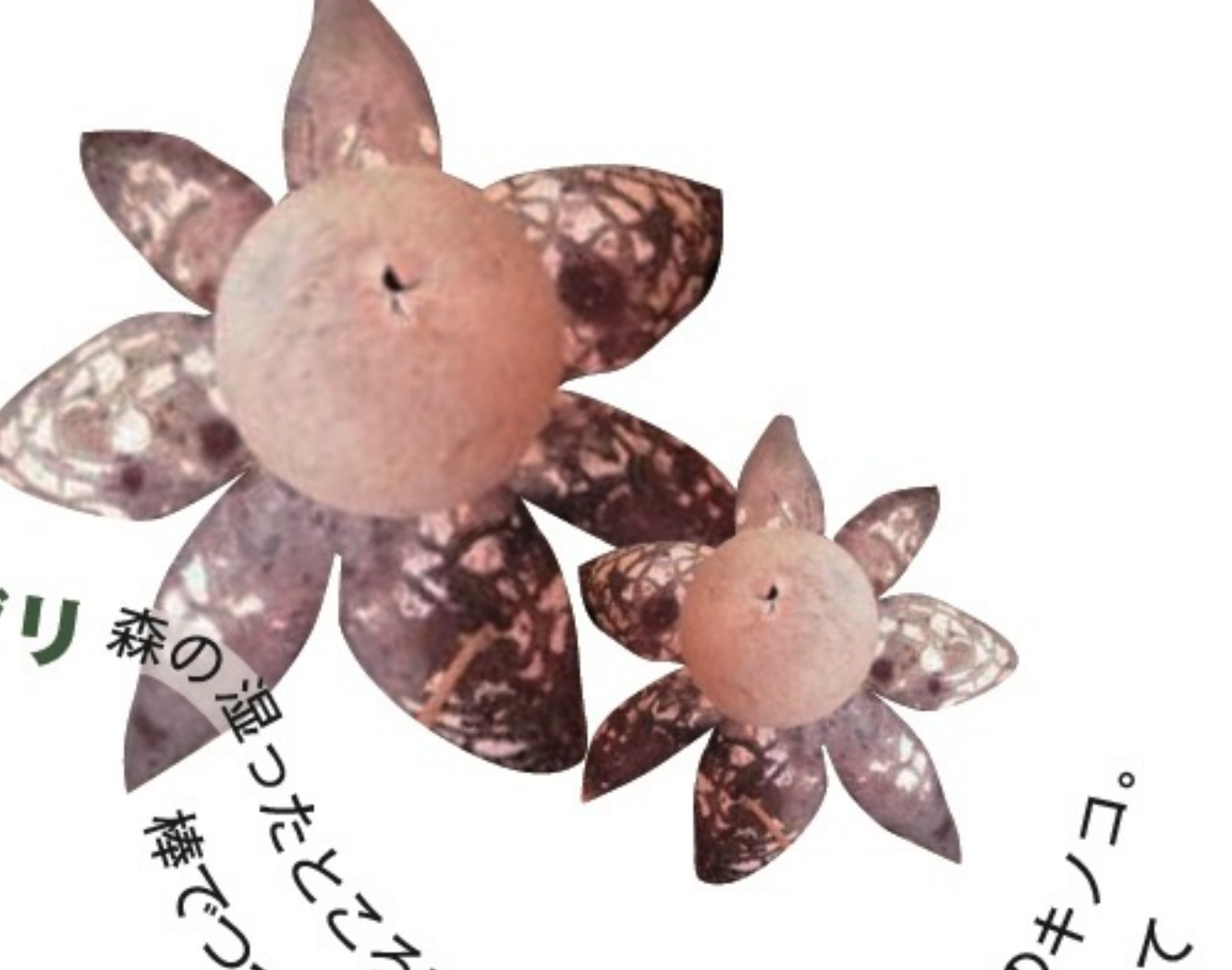
ツツグリ 森のあちこちで見つかる、不思議な花のキノコ。棒でつつくと、中から煙のような胞子が出てきておもしろいよ!