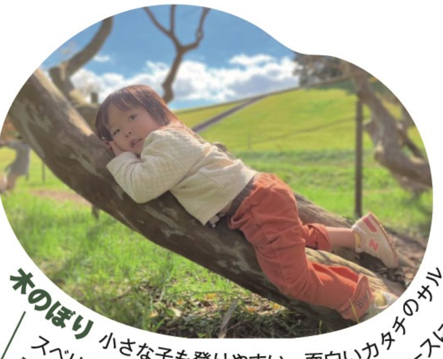
木のぼり 小さな子ども登りやすい、面白いカタチのツツギ。スベリがたくさん。人がいなければ、自転車コースに入っても遊べてOKだよ!