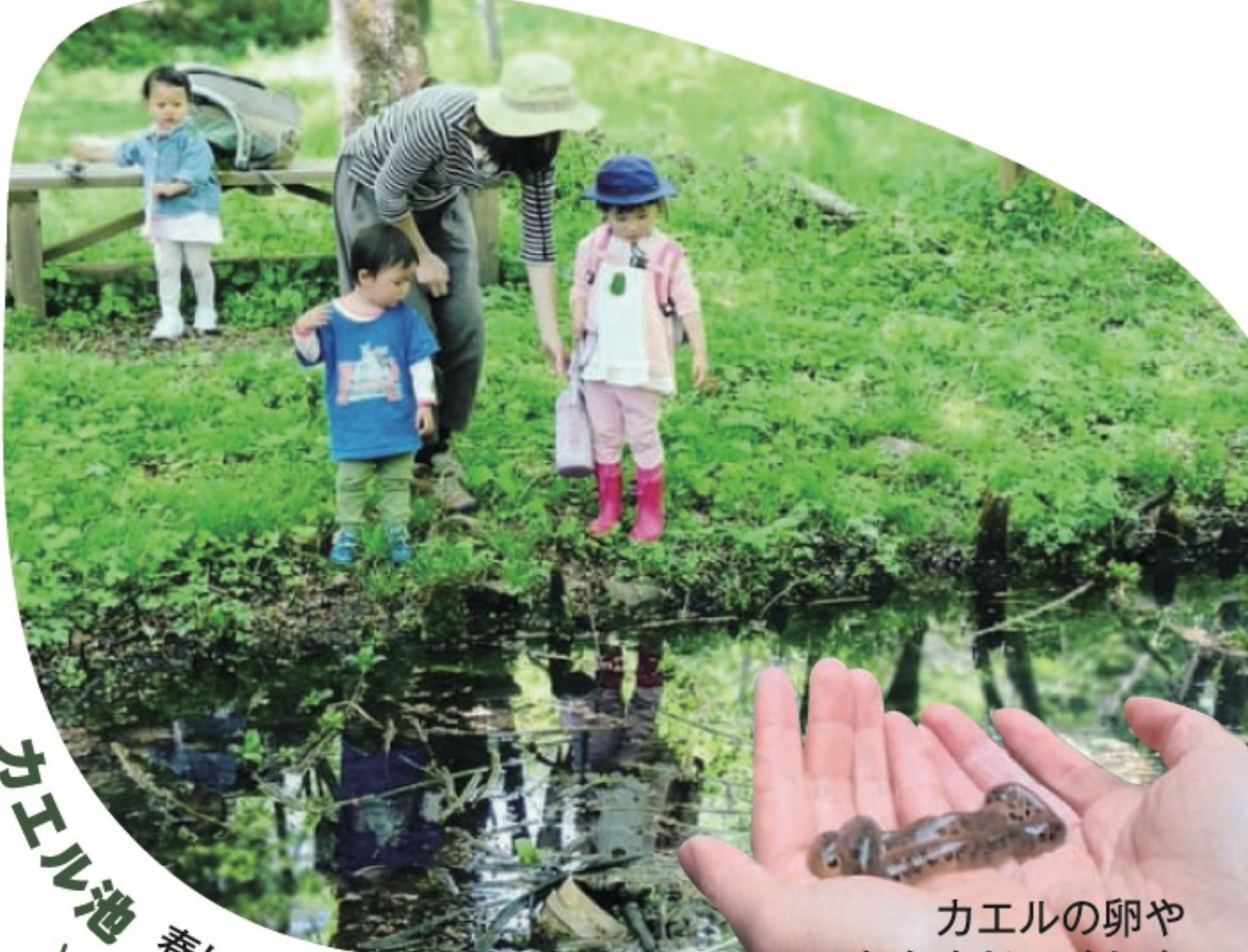
カエル池 春になるとヒキガエルが卵を産みにやってくる。産んだあとは、山の中へ帰って行くよ。